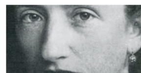
Les Amis de Janet

Ces mémoires, écrits à la première personne, couvrent la période 1939-1945 et se situent dans le village de Valleraugue, où l'auteure a choisi de se mettre à l'abri avec ses enfants. Dans cette chronique où tout fait événement – de la quête de nourriture à l'annonce de l'armistice –, l'écriture, fine et élégante, sait restituer l'émotion des moments les plus forts tout en laissant s'exprimer l'humour, l'insolence et le rire d'une jeune femme profondément éprise de la vie.